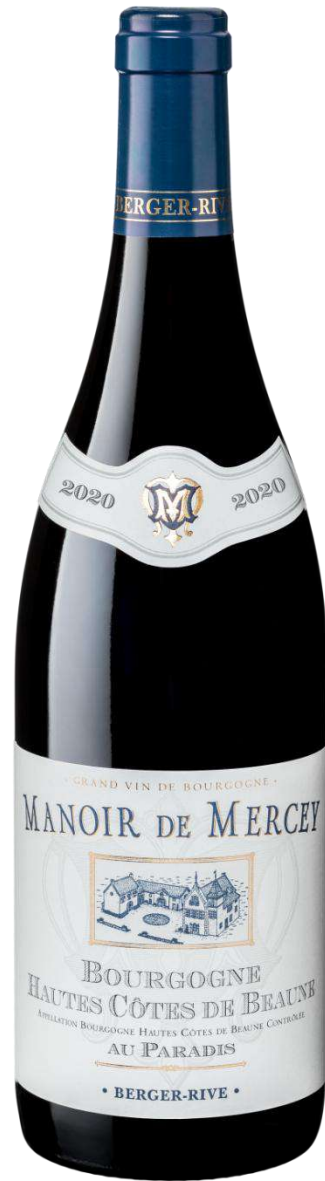
Manoir de Mercey Hautes Côtes de Beaune « Au Paradis »