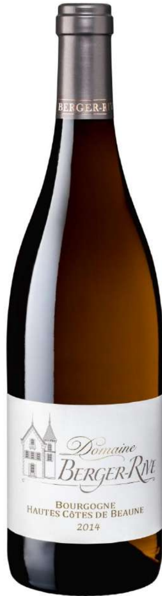
Domaine Berger-Rive Hautes Côtes de Beaune