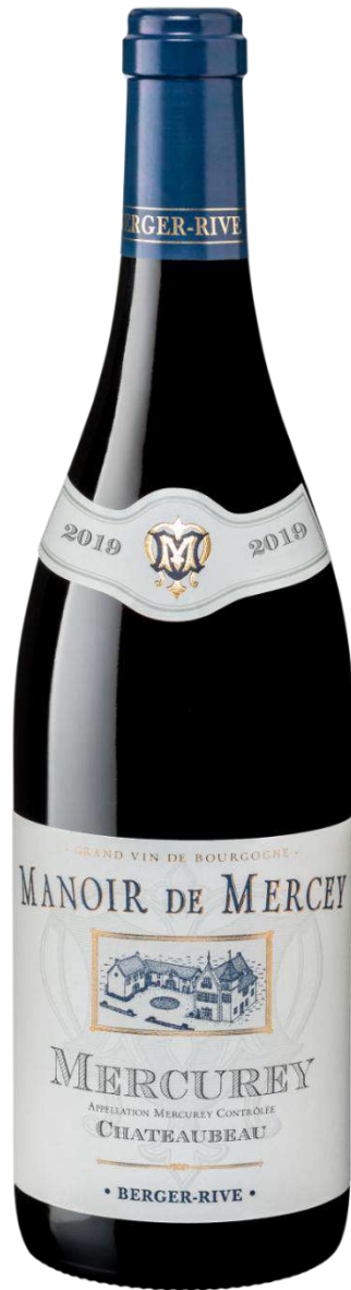
Manoir de Mercey Mercurey « Chateaubeau »