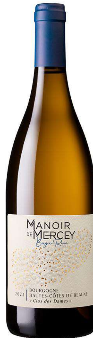
Manoir de Mercey Hautes Côtes de Beaune « Clos des Dames »