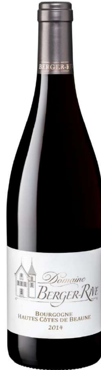
Domaine Berger-Rive Hautes Côtes de Beaune