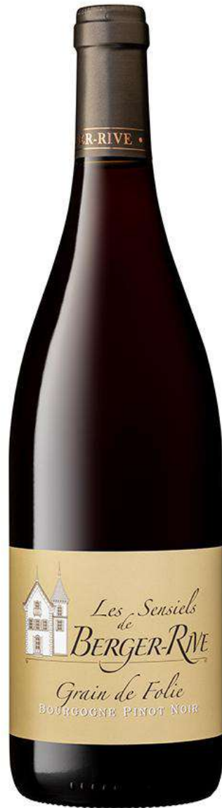
Les Sensiels de Berger-Rive Bourgogne Pinot Noir « Grain de Folie »