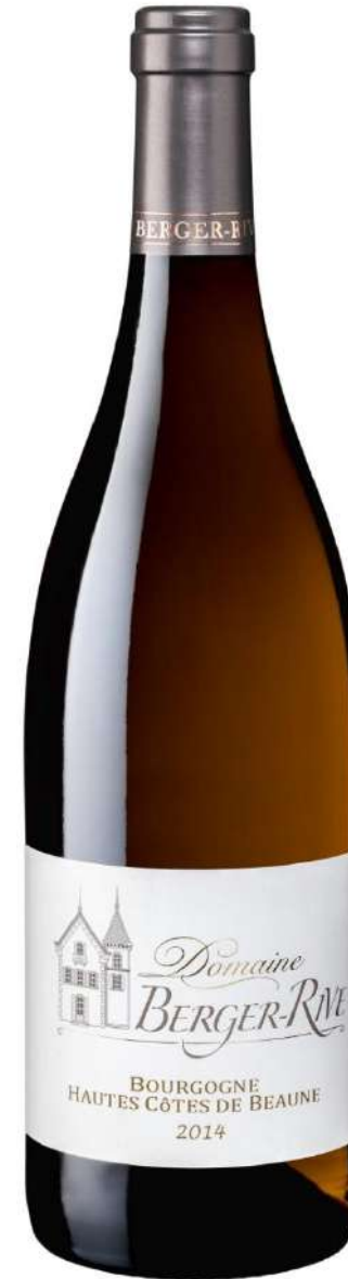
Domaine Berger-Rive Hautes Côtes de Beaune