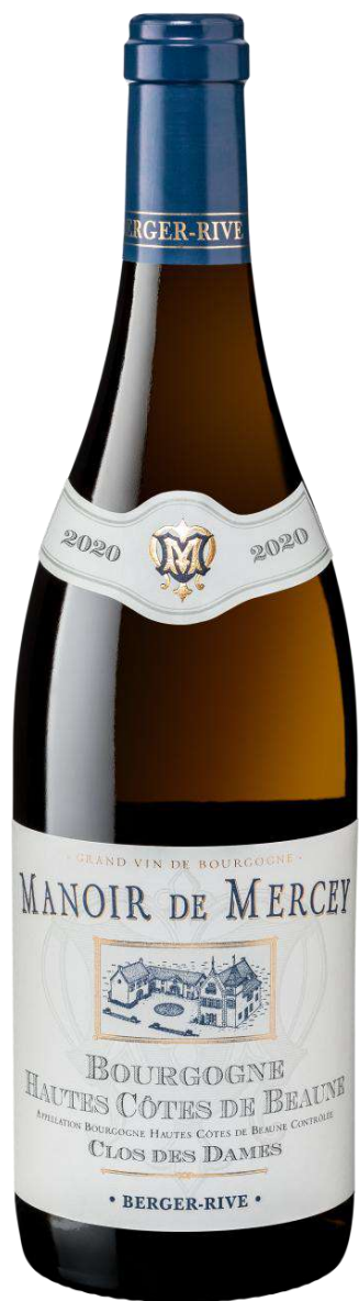
Manoir de Mercey Hautes Côtes de Beaune « Clos des Dames »