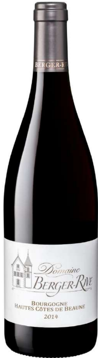
Domaine Berger-Rive Hautes Côtes de Beaune