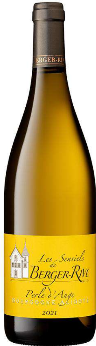
Les Sensiels de Berger-Rive Bourgogne Aligoté « Perle d'Ange »