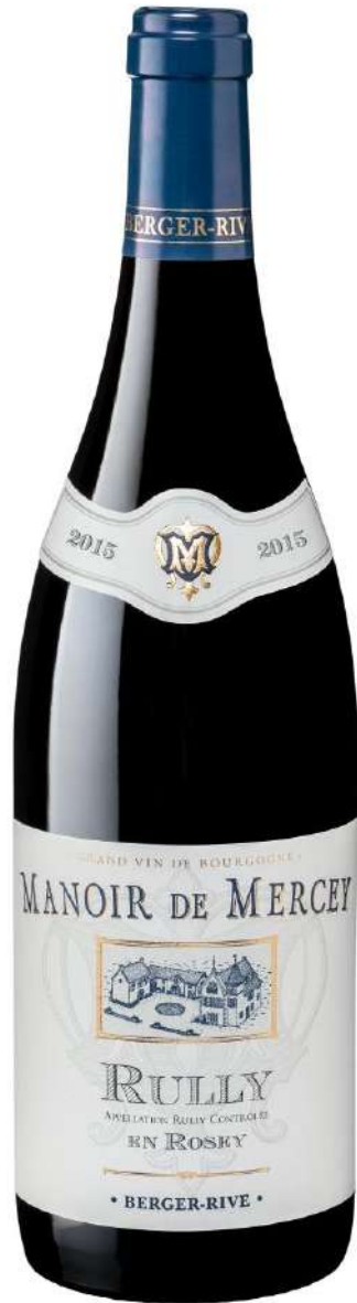
Manoir de Mercey Rully « En Rosey »