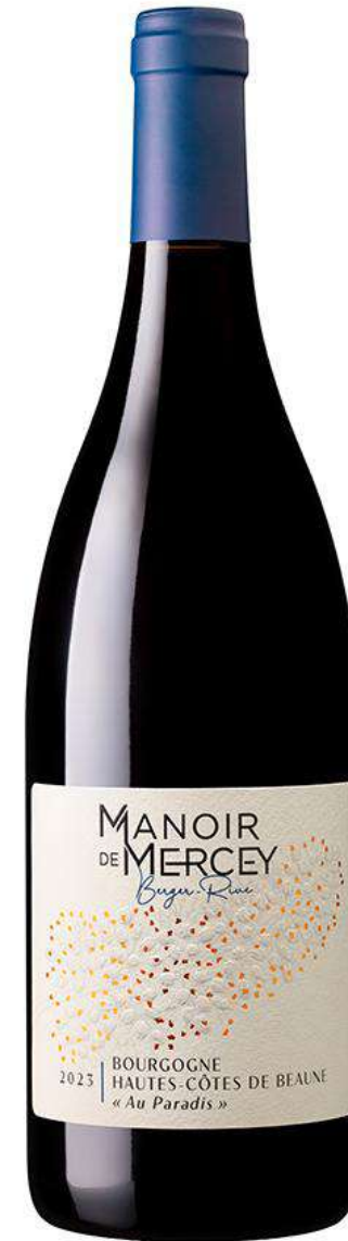
Manoir de Mercey Hautes Côtes de Beaune « Au Paradis »