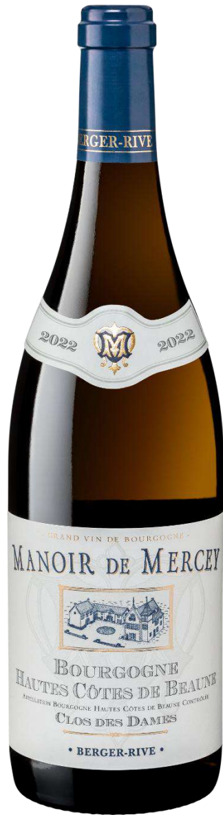
Manoir de Mercey Rully « Cuvée Louise »